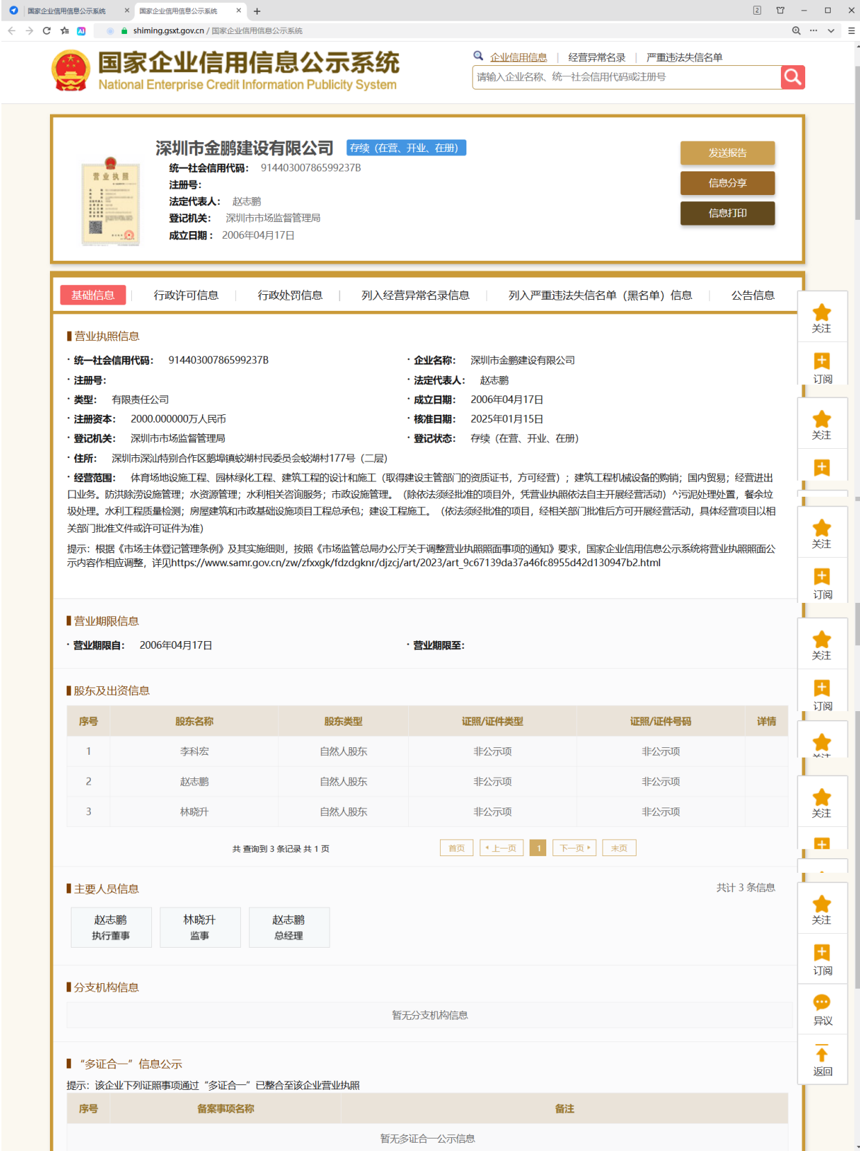
国家企业信用信息公示系统截图