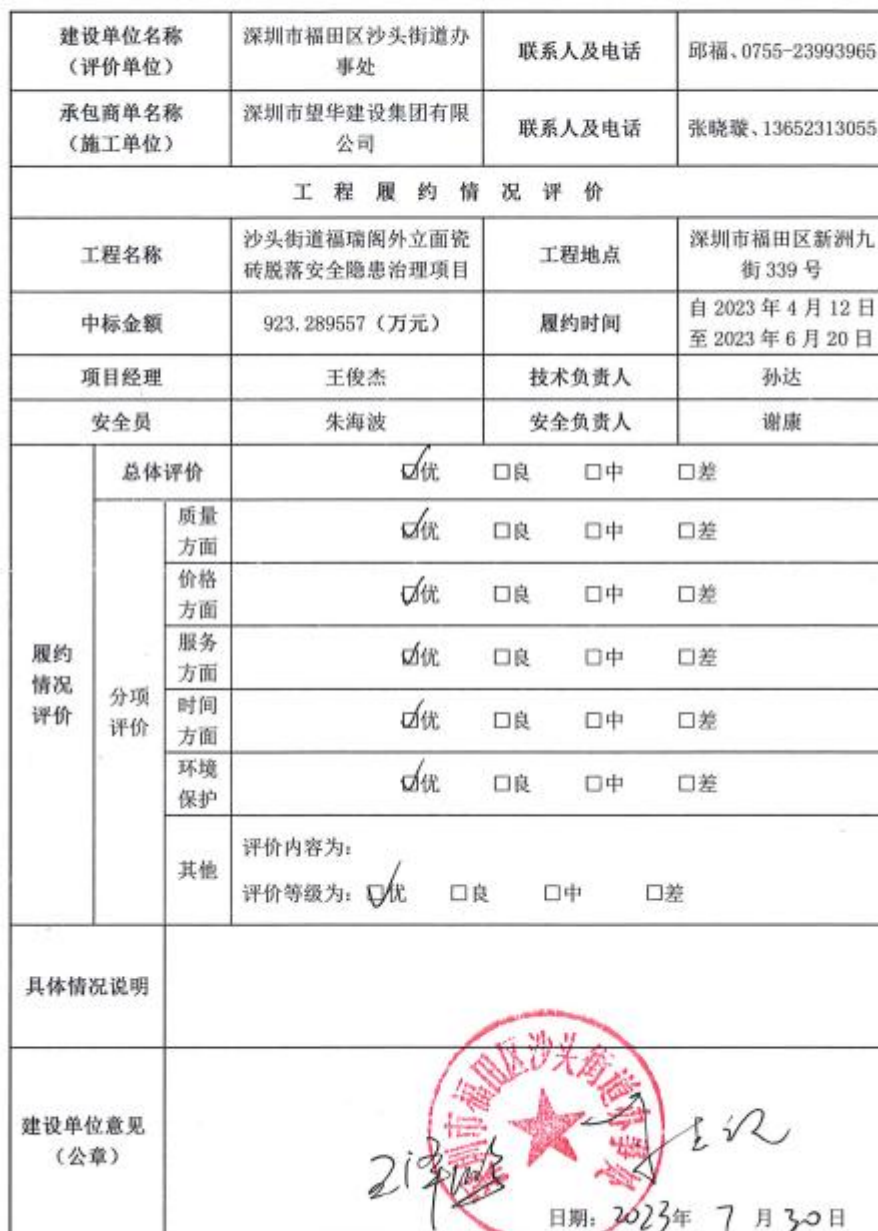
深圳市建设工程承包商履约评价表