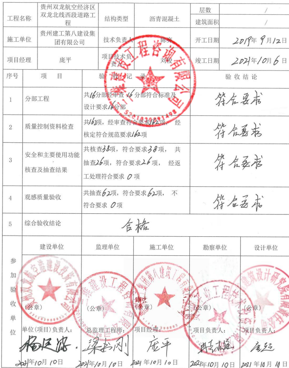
单位(子单位)工程质量竣工验收记录

注: 验收记录由施工单位填写, 验收结论由监理(建设)单位填写。综合验收结论由参加验收各方共同商定, 建设单位填写, 应对工程质量是否符合设计和规范要求的质量水平做出评价。