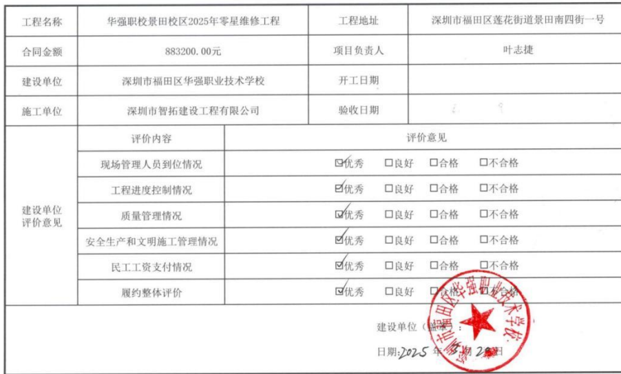
工程履约情况评价表