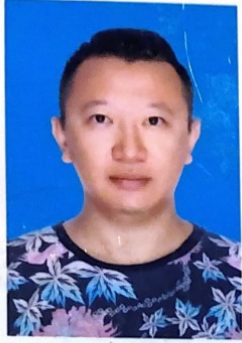
(加盖授予部门钢印有效)