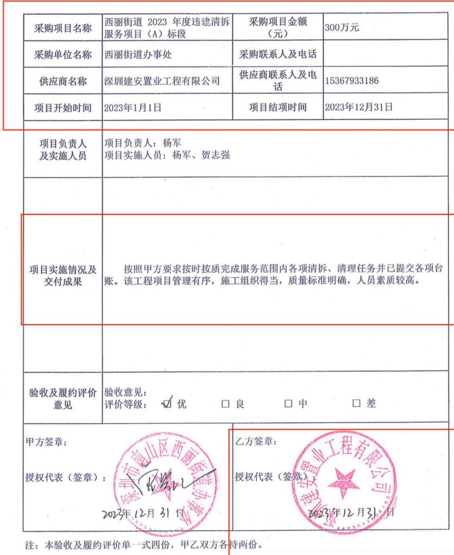
采购项目验收和履约情况评价表