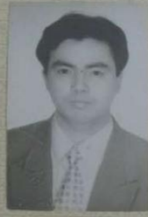
(无国家教育委员会成人高等教育证书专用章无效)