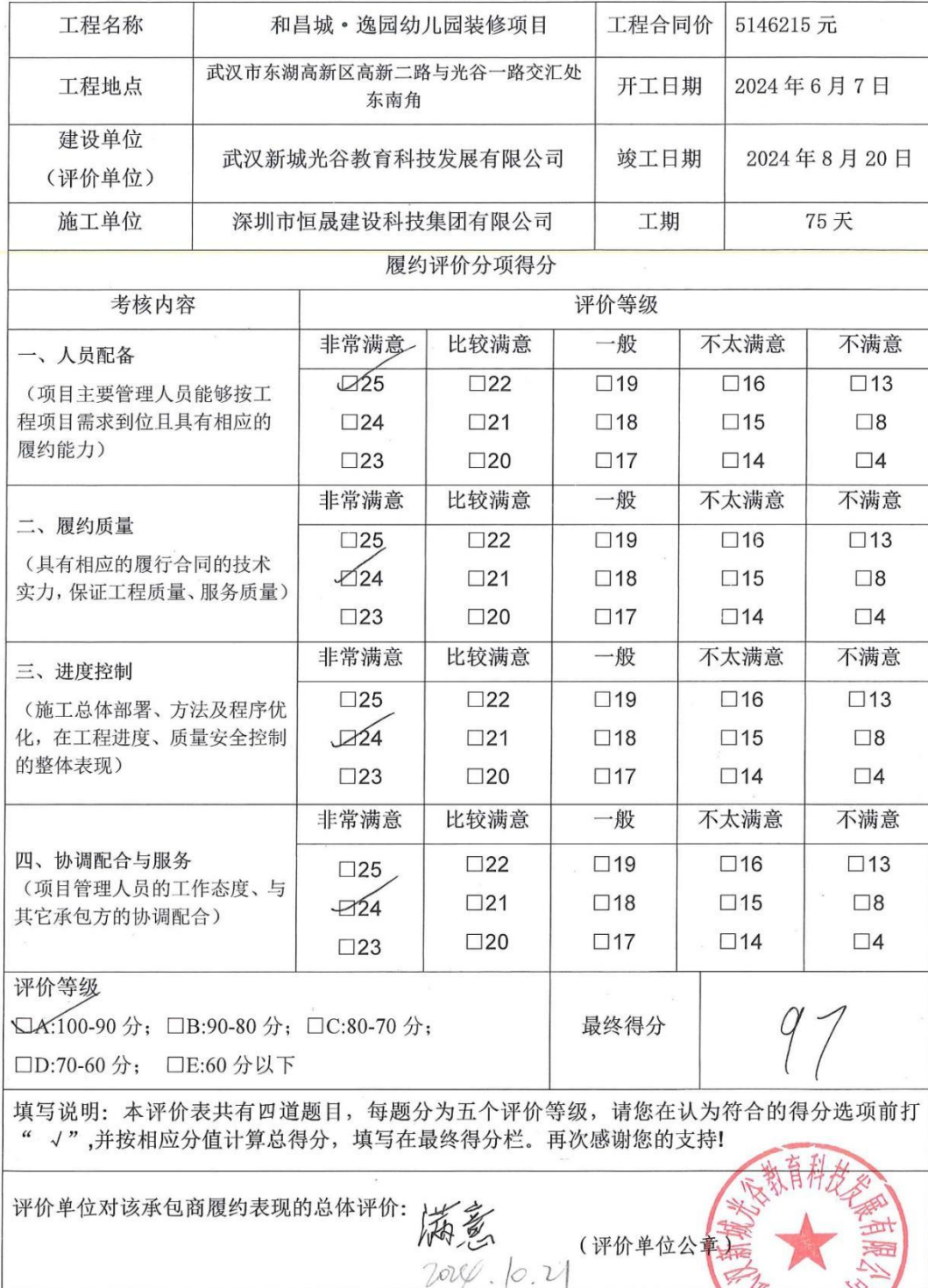
工程项目履约评价表