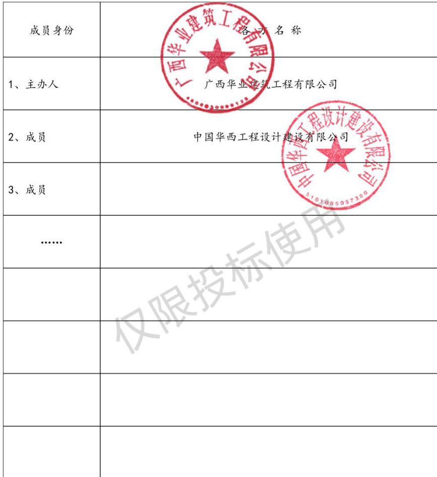
联合体投标情况表