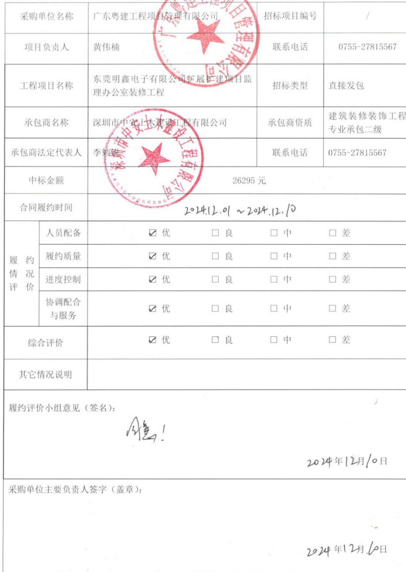
项目履约评价备案表（工程）