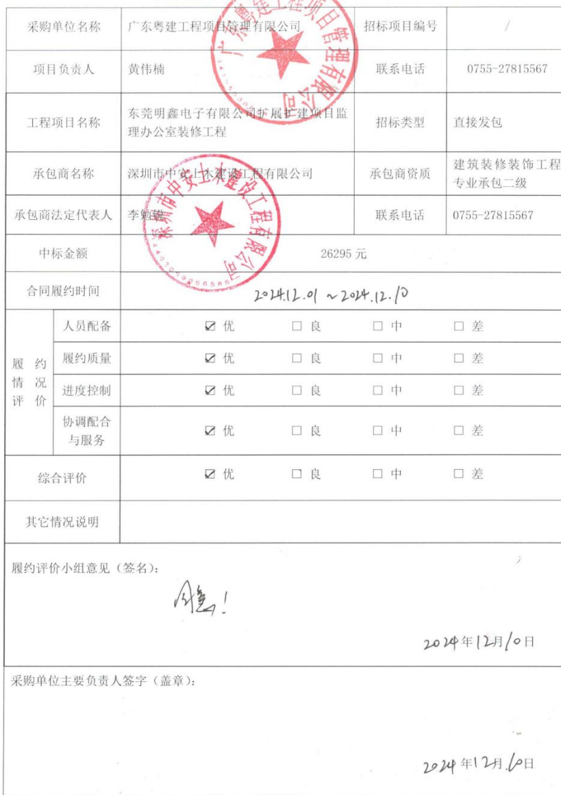
项目履约评价备案表（工程）