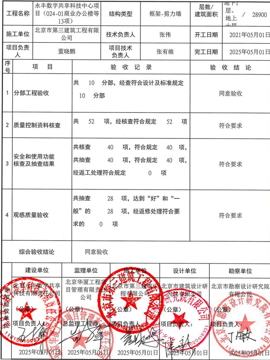
单位工程质量竣工验收记录 表C8-1