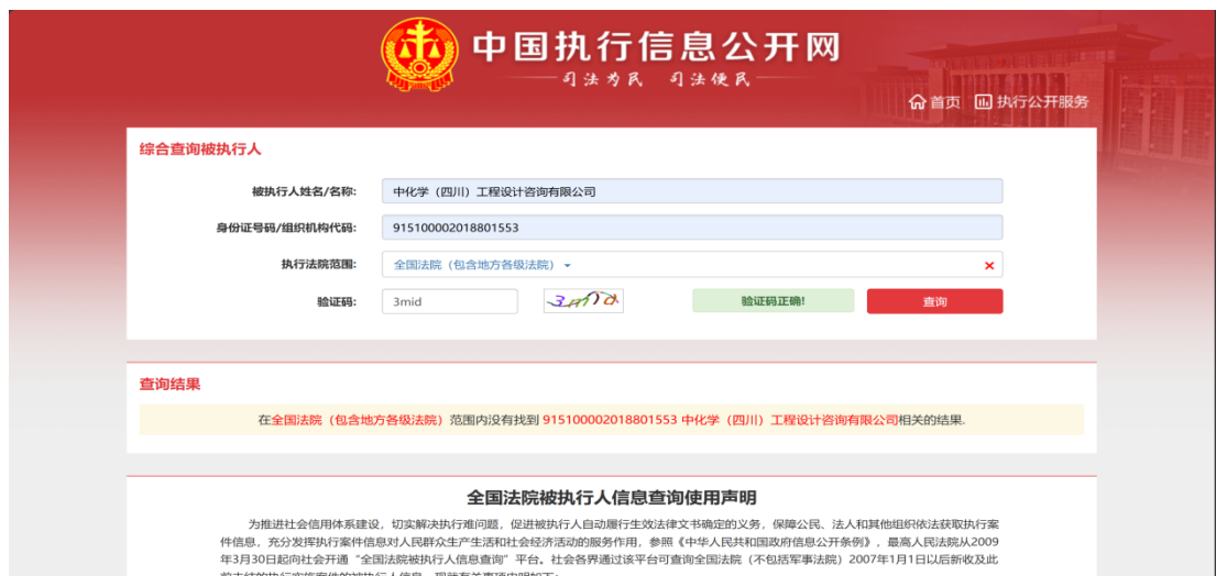
中国执行信息公开网截图