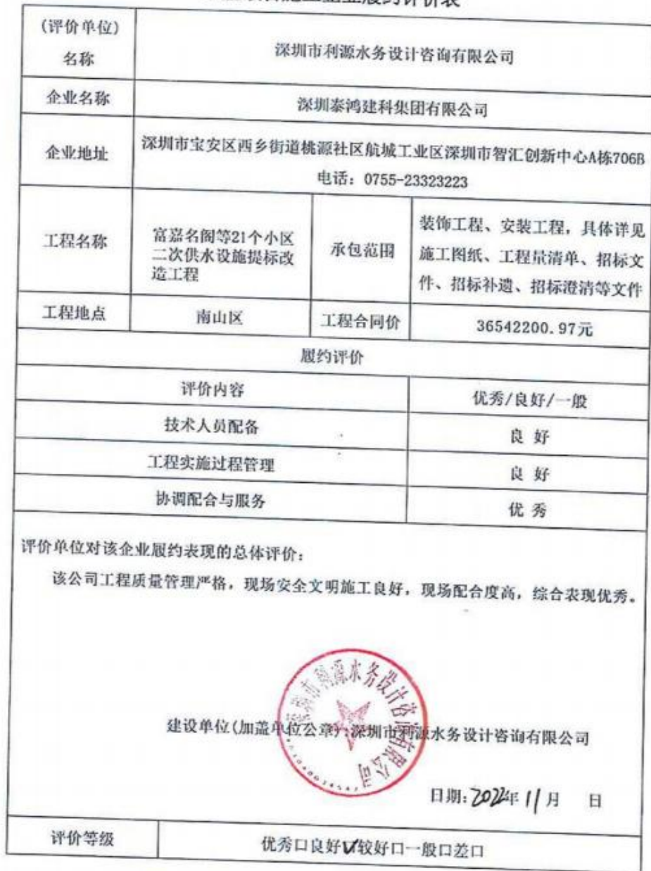
工程项目施工企业履约评价表