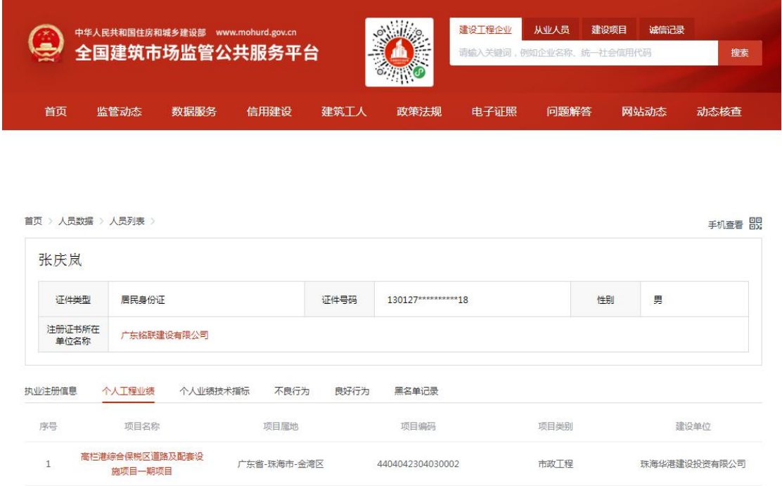
全国建筑市场监管公共服务平台截图