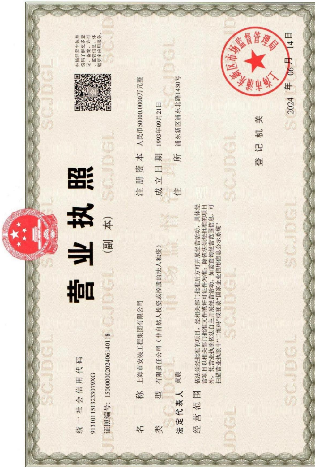
投标人营业执照（扫描件）