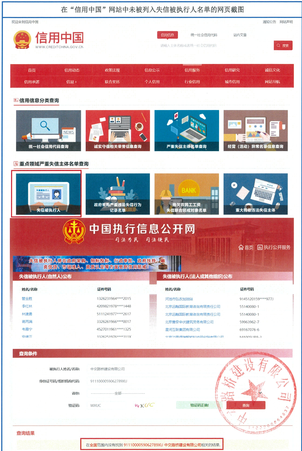
在“信用中国”网站中未被列入失信被执行人名单的网页截图