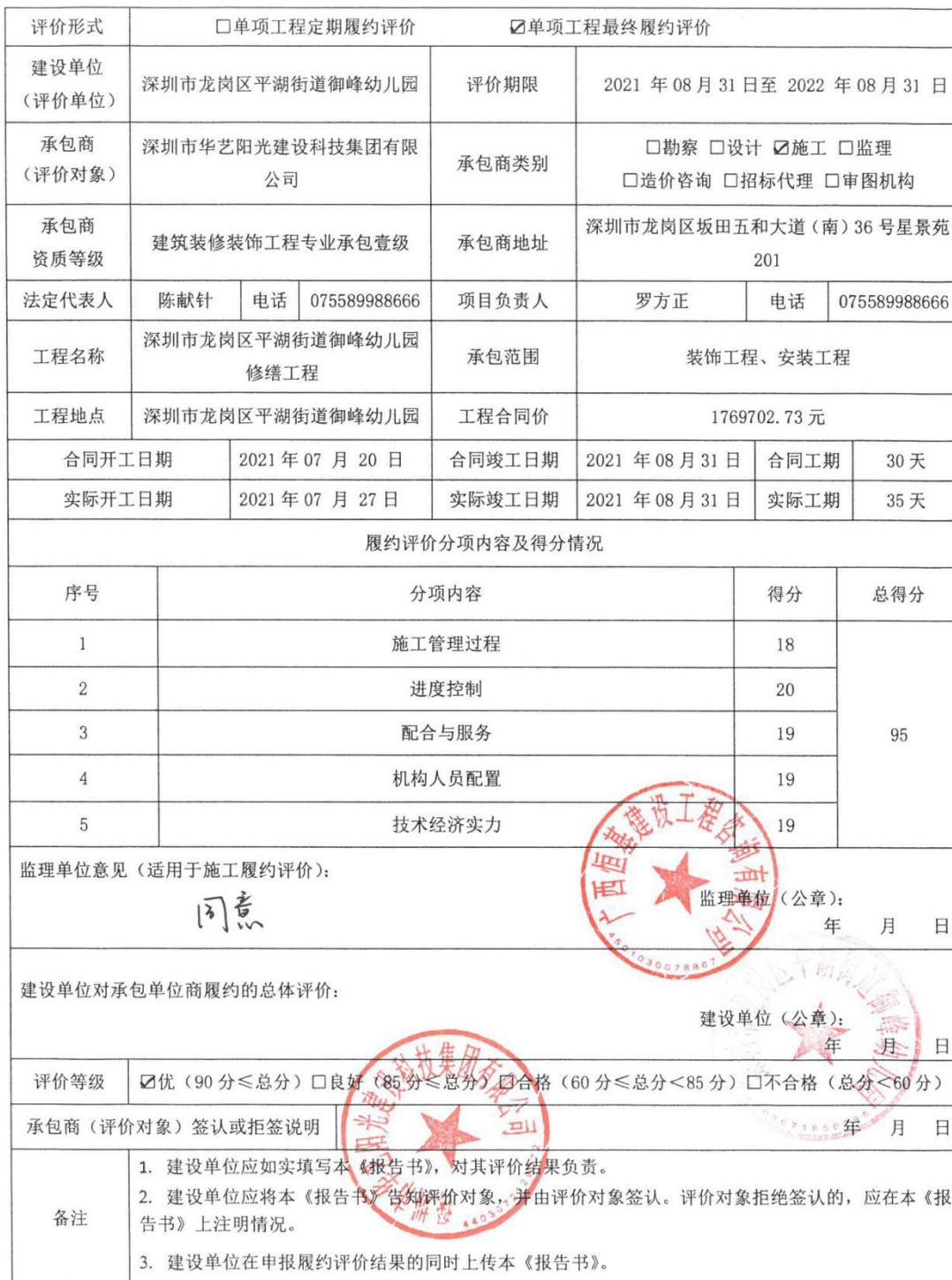
建设工程承包商单选工程履约评价报告书