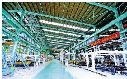
中建科工绿色科技公司扎根光明, 积极参与与科学城开发建设。

2022年, 在区委区政府的坚强领导下, 光明区住房和城乡建设局(简称: 区住建局)牢牢把握建筑产业高质量发展主脉, 强化建筑科技产业专项扶持, 积极展示区域发展潜力, 招商引资效果显著, 实现辖区建筑业跨越式高速发展。据统计, 2022年全区42家纳统建筑业企业, 统计系统平台累计产值158.64亿元, 增速超50%, 其中多家企业产值报送超10亿元。