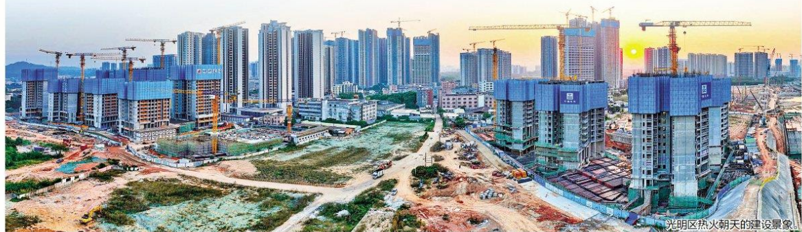
光明区热火朝天的建设景象。