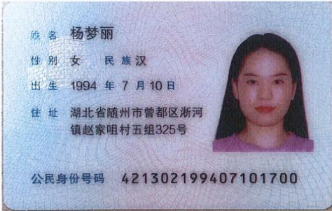
委托代理人身份证复印件