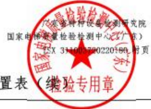
乘客和载货电梯适用参数范围和配置表 (续)