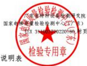
表2 本证书对应的各型式试验报告的内容说明表