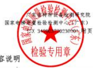
表4 本证书对应的各型式试验报告的内容说明