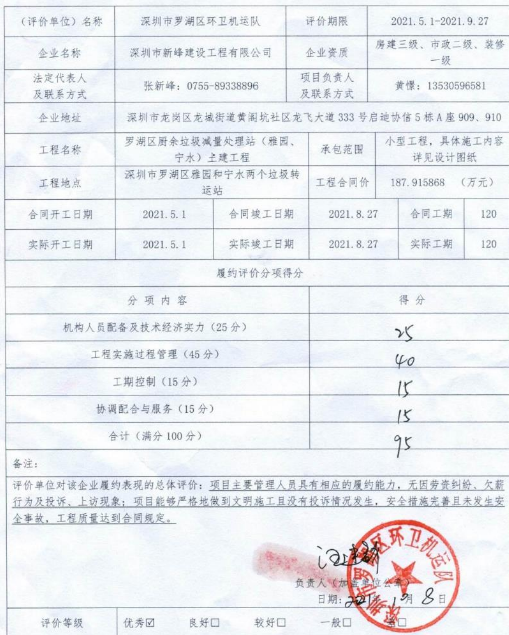
履约评价情况反馈表

说明: 1. 评价栏中需评价单位法定代表人或主要负责人签字并加盖单位公章, 无签名无效。 2. 履约情况分为优秀、良好、较好、一般、差, 请首先在对应的类别前打“√”, 然后在“具体情况”一栏详细说明情况。