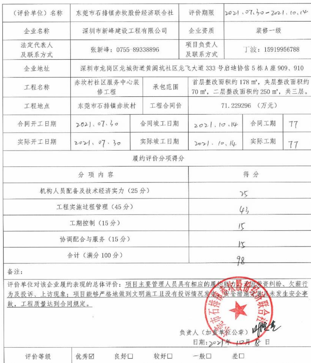
履约评价情况反馈表

说明: 1. 评价栏中需评价单位法定代表人或主要负责人签字并加盖单位公章, 无签名无效。 2. 履约情况分为优秀、良好、较好、一般、差, 请首先在对应的类别前打“√”, 然后在“具体情况”一栏详细说明情况。