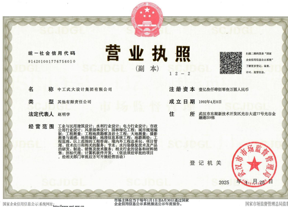
国家企业信用信息公示系统截图