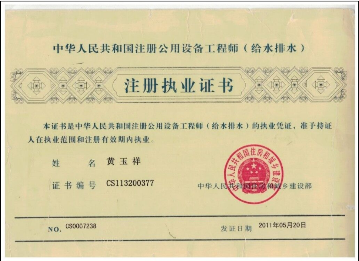
注册公用设备工程师（给水排水）执业资格证书

4、其他：项目负责人执业资格证书或职称证书（原件扫描件）、 《廉政责任承诺书》原件扫描件（必须提供加盖公章的扫描件）