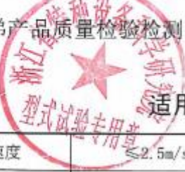
适用参数范围和配置表