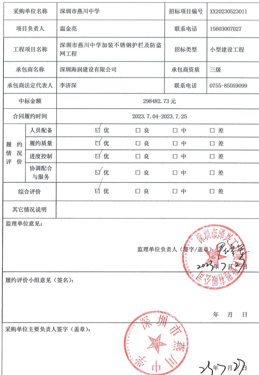
学校、幼儿园招标项目履约评价备案表（工程）