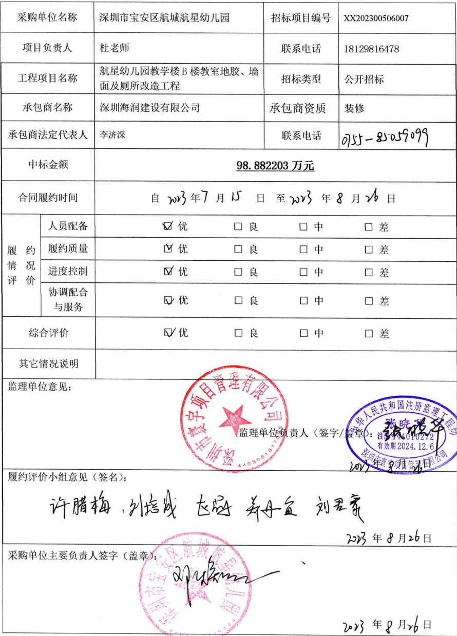
学校、幼儿园招标项目履约评价备案表（工程）