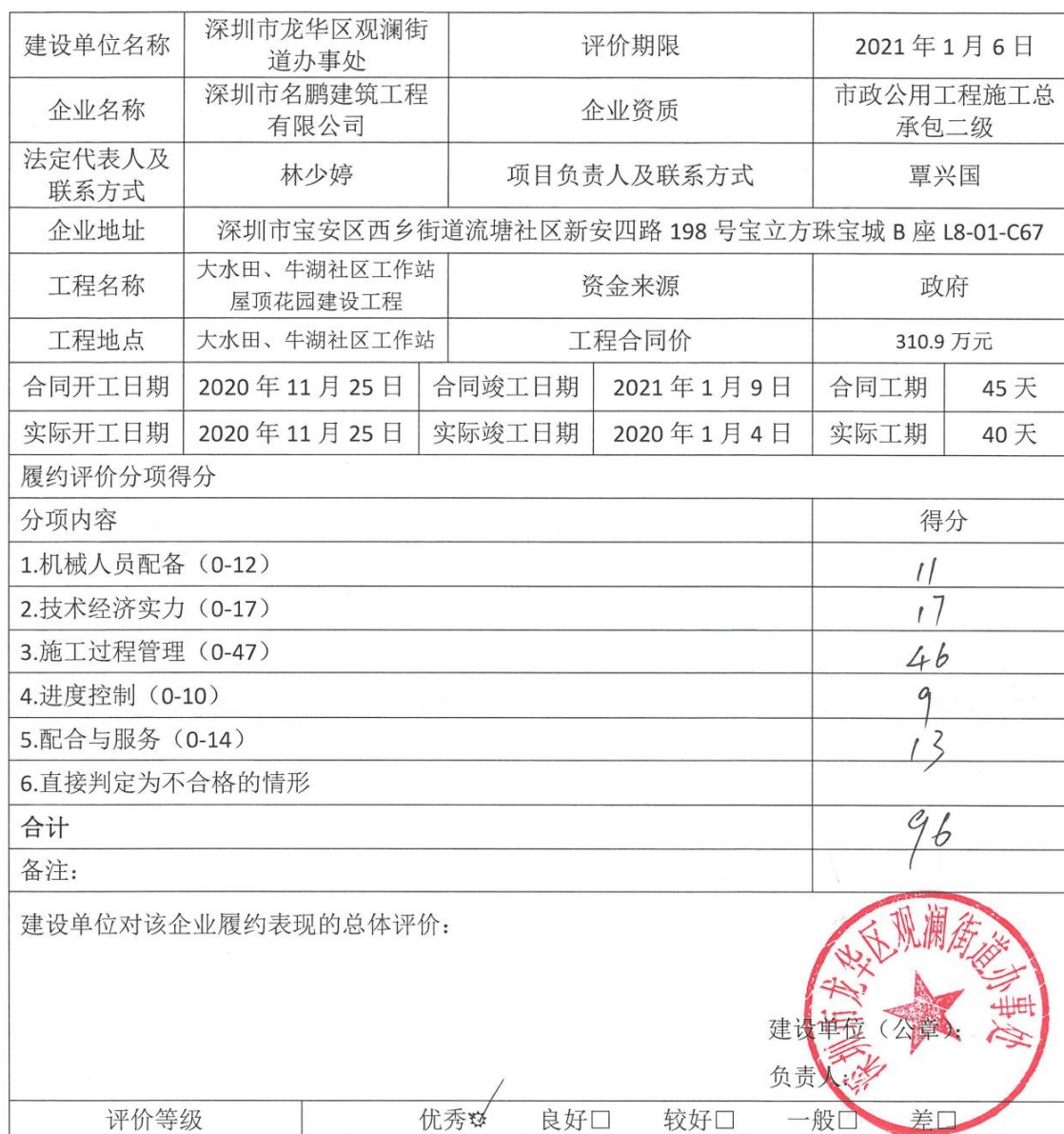
履约评价情况反馈表

说明: 1.评价栏中需评价单位法定代表人或主要负责人签字并加盖单位公章, 无签名无效。