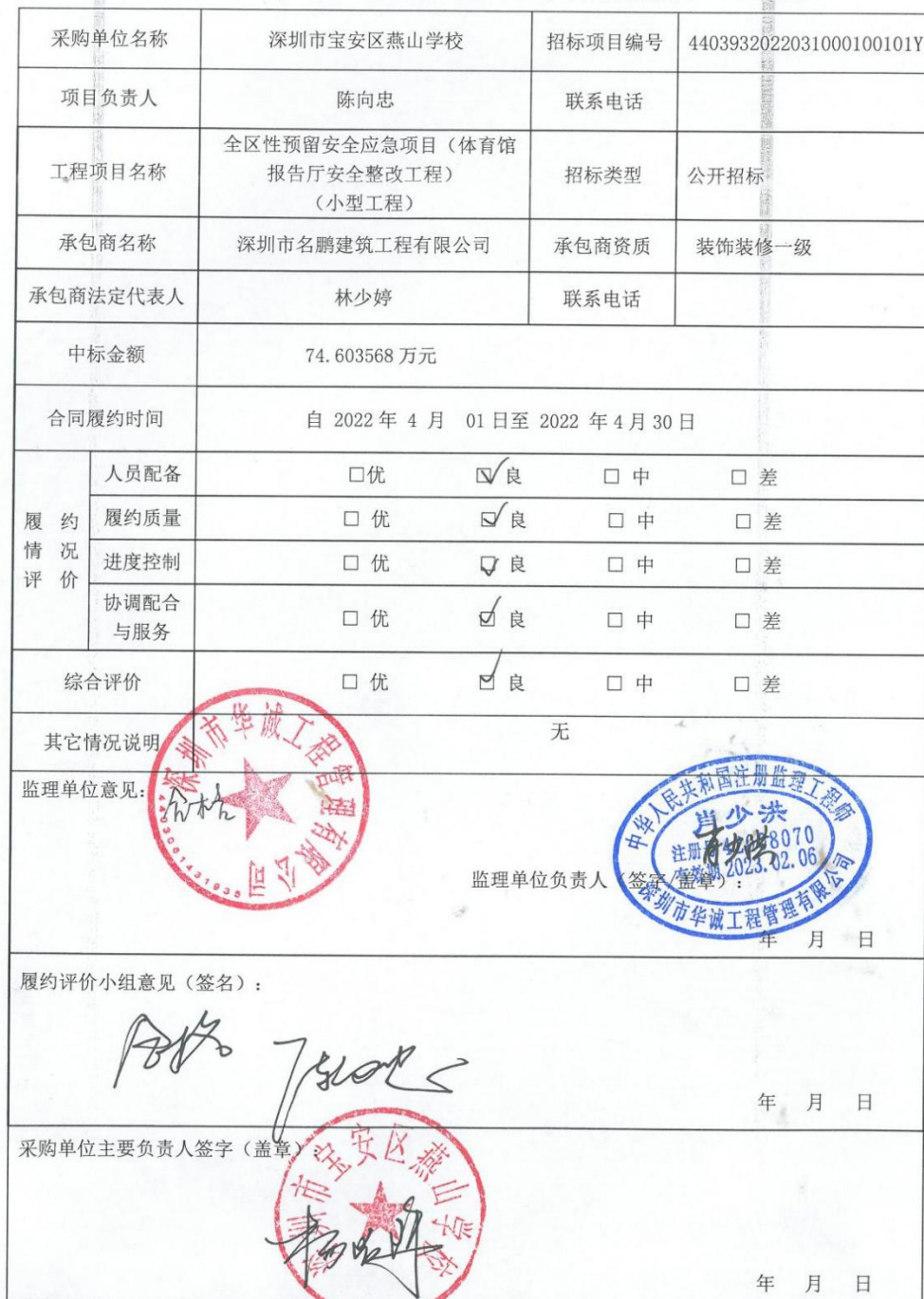
学校、幼儿园招标项目履约评价备案表（工程）