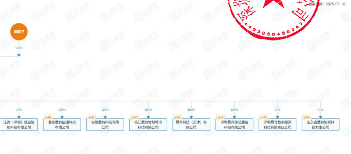
图 股权穿透图 3