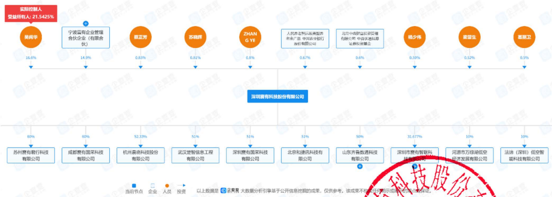
图 股权穿透图 2