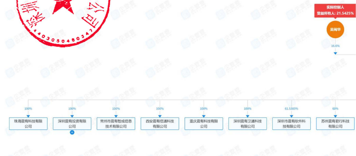
图 股权穿透图 1