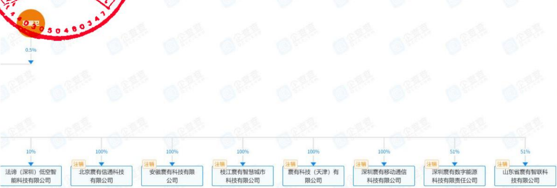
图 股权穿透图 3