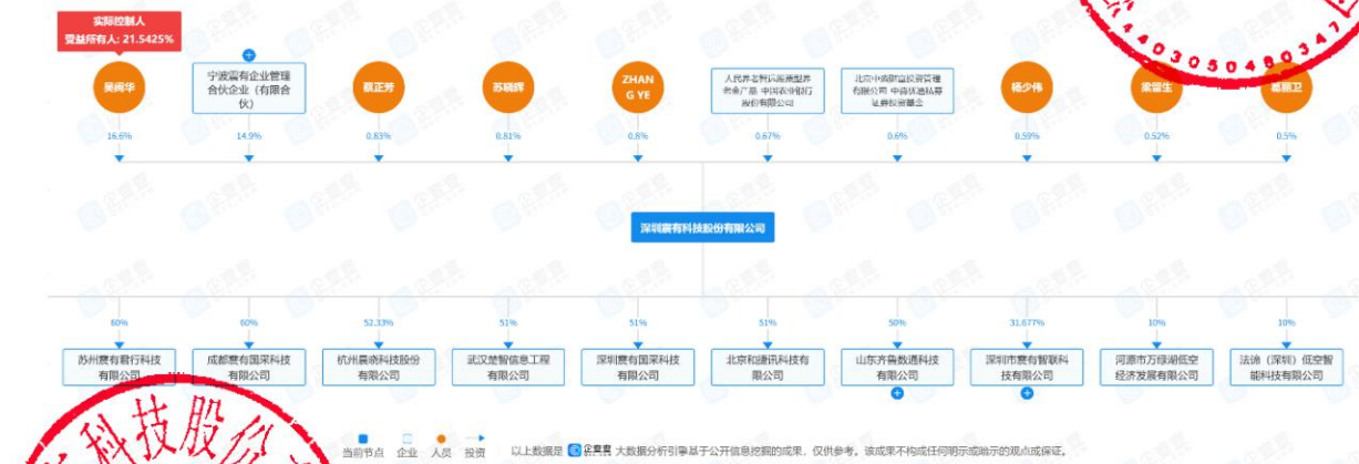
图 股权穿透图 2