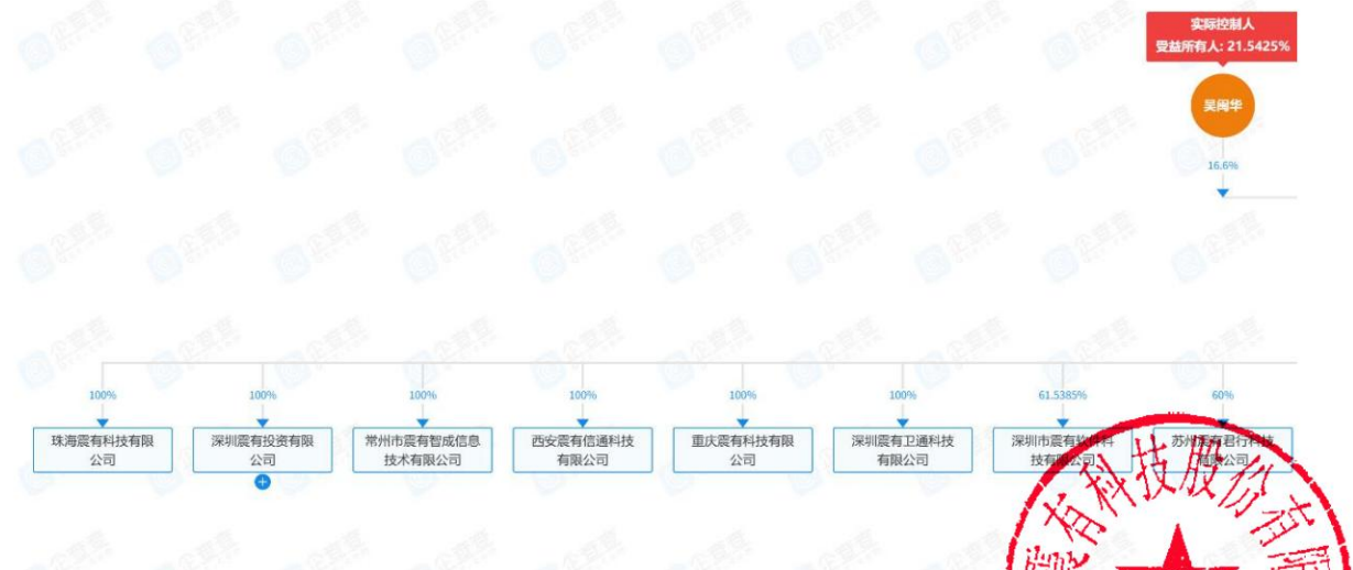
图 股权穿透图 1