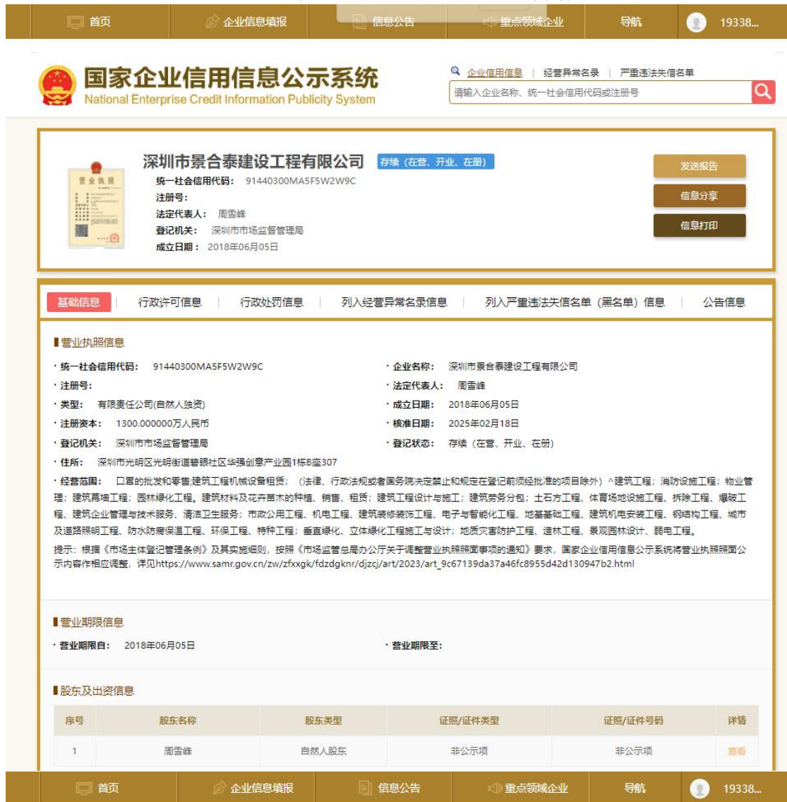
(4) 国家企业信用信息公示系统查询截图