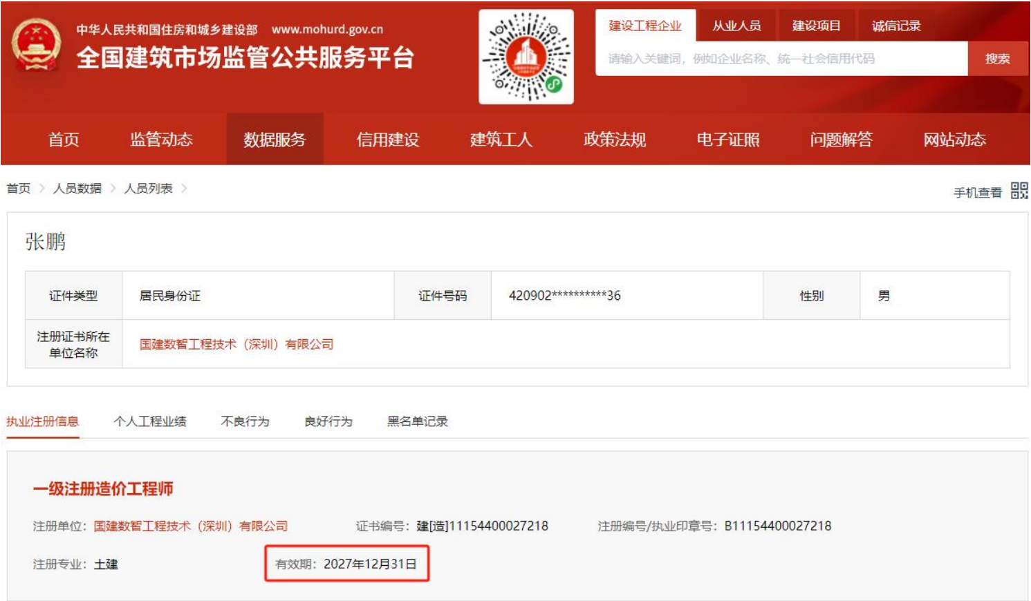
全国建筑市场监管公共服务平台查询截图