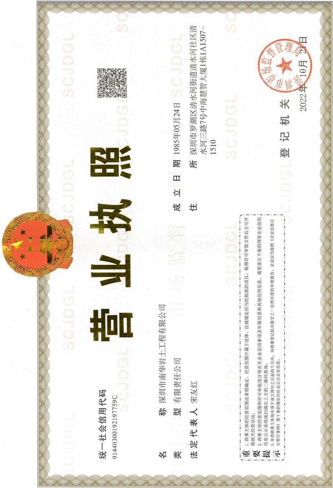
(1) 通过年审的营业执照副本（原件扫描件）