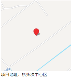
项目地址：桥头次中心区